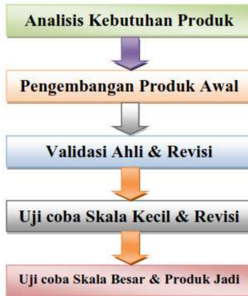
Gambar 2. Desain model 5 langkah Puslitjaknov

Desain model puslitjaknov tahun 2008, dikembangkan oleh tim yang bekerja pada pusat penelitian dan pengembangan kebijakan kementerian pendidikan dan kebudayaan yang dahulu kala dikenal dengan Departemen Pendidikan Nasional. Desain model ini berawal dari langkah/tahapan penelitian dan pengembangan Borg & Gall yang telah disederhanakan. Berikut langkah atau tahapan dari desain model 5 langkah/tahapan puslitjaknov.